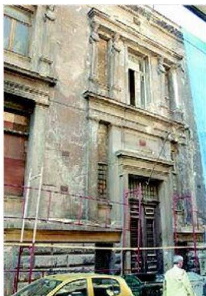
Το σπίτι του Ερνέστου Τσίλερ στην οδό Μαυρομιχάλη. Στην επάνω δεξιά γωνία διακρίνεται η γκρεμισμένη Καρυάτιδα.