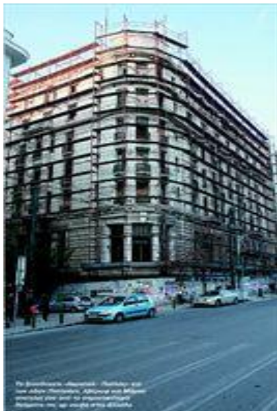
Το ξενοδοχείο «Ακροπόλ – Παλλάς» επί των οδών Πατησίων, Αβέρωφ και Μάρνη αποτελεί ένα από τα σημαντικότερα δείγματα της αρ νουβό στην Ελλάδα.

προκειμένου να τα εκθέσει στο νέο κτίριο. Σήμερα, η ΥΦΑΝΕΤ, ένα από τα σημαντικότερα δείγματα βιομηχανικής αρχιτεκτονικής στη χώρα, παραμένει εστία μόλυνσηςκαταρρέοντας υπό το βάρος της εγκατάλειψης. Οι μόνοι που φαίνεται να το... φροντίζουν είναι ίσως οι δεκάδες νεαροί καταληψίες του, που κατοικούν σε μια πτέρυγα του κτιρίου.