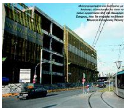
Μισογκρεμισμένο και τυλιγμένο σε λινάτσες εξακολουθεί να είναι το παλιό εργοστάσιο Φιξ στη Λεωφόρο Συγγρού, που θα στεγάσει το Εθνικό Μουσείο Σύγχρονης Τέχνης.