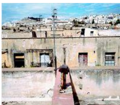
Από τα 228 διαμερίσματα που αποτελούν τις προσφυγικές πολυκατοικίες της Λεωφ. Αλεξάνδρας, μόλις τα 51 κατοικούνται σήμερα.